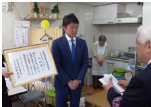
当選証書が授与される。

私はこれまで12年間、野党の一員として政治活動を行って参りましたが、この度の区議選において初めて、政党の後ろ盾を得ずに無所属で挑戦を致しました。この間、行財政改革や地方分権改革の必要性を訴え、時として野党勢力を代表する立場で、江東区長選挙に2度挑戦させて頂いた経験もあります。しかしながら、やるべき改革を政党として掲げながらも、それらをやり遂げる以前に政党が分裂や解党してしまう、という場面に度々直面し、その都度、お支え頂いている方々にもご心配やご迷惑をお掛けして参りました。この度の区議選を機に、これまでの「スローガン」で終わってしまう政治と決別し、自身が掲げる約束をしっかりと実現し、具体的に地域に役立てる政治活動を行って参りたいと考え、まずは裸一貫となり無所属で挑戦をさせていただきました。これからは、区議会の場で、先述の通りの政治活動を行って参るためにも、結束して物事に取り組める政党を自らの意志で選択して参りたいと考えております。そのスタートとなる今年度においては、一人会派『江東区議会きずなを守る会』を立ち上げて議会活動を出発させていただきました事も、併せてご報告をさせていただきます。