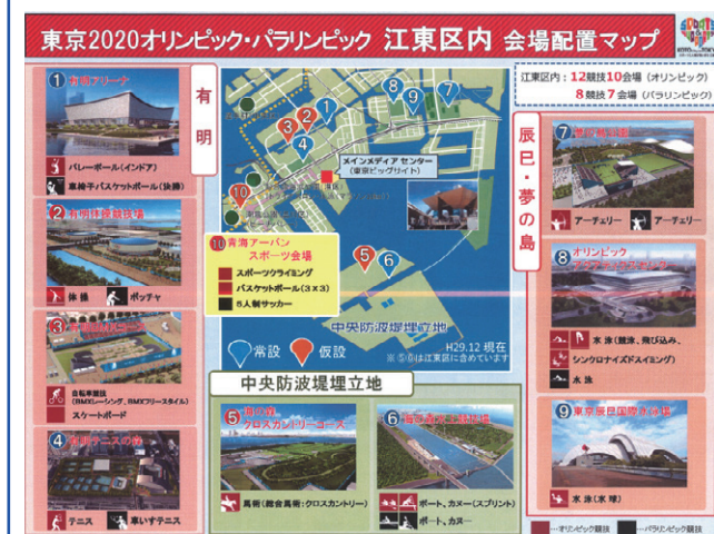
江東区内会場配置マップ